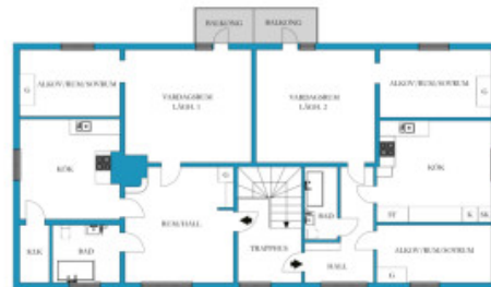
VÄN 1 TR

THESE DRAWINGS CAN FORM PART OF A PROJECT AND MUST NOT BE REPRODUCED OR TRANSMITTED IN ANY FORM OR BY ANY MEANS, ELECTRONIC OR MECHANICAL, INCLUDING PHOTOCOPYING, RECORDING, OR BY ANY INFORMATION STORAGE AND RETRIEVAL SYSTEM.